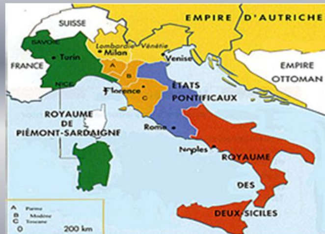
Carte de l'Italie avant l'unité italienne

Au début du XIX e siècle, l'Italie n'a pas d'unité: elle est morcelée en plusieurs Etats. En 1848, des révolutions pour les libertés et l'unification de l'Italie échouent. En 1852, le roi de Piémont Victor-Emmanuel II nomme un premier ministre partisan de l'unité, Cavour. En 1870, Rome devient la capitale, l'unification est achevée .