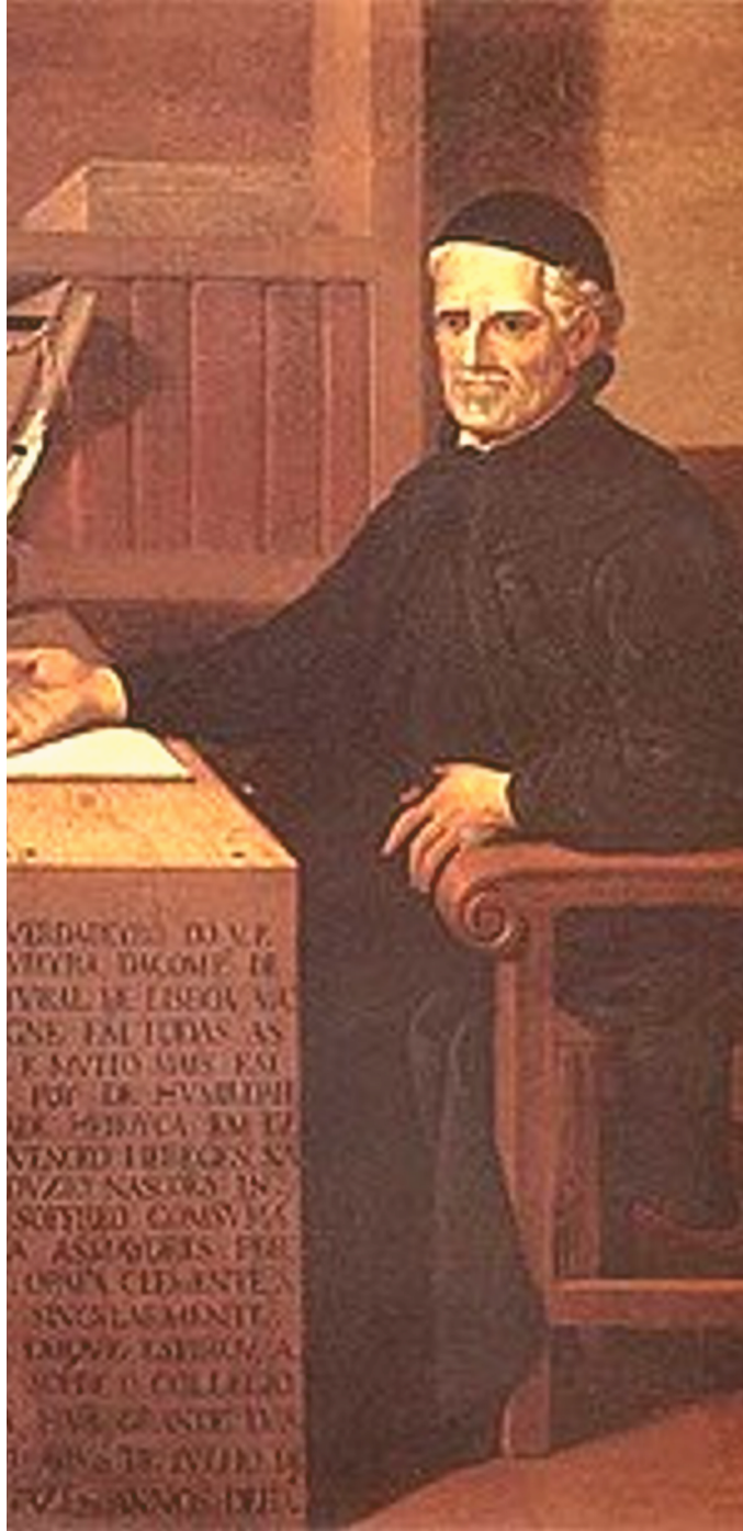
PADRE ANTÓNIO VIEIRA

Ses positions en faveur des droits humains des peuples indigènes du Brésil ainsi qu'en faveur des Juifs, et sa critique de l'esclavage et de l'Inquisition, témoignent de la modernité de sa pensée. Dans Message, Fernando Pessoa le nomme, « Empereur de la langue portugaise ».