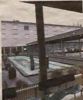
La construction des bâtiments de l'annexe date des années 60.

MERSCH L'annexe du Lycée classique de Diekirch, à Mersch, sera entièrement rénovée d'ici 2021. L'enveloppe, de 47,5 millions d'euros, et le déroulement des travaux ont été présentés jeudi aux députés. La capacité d'accueil du lycée sera étendue de 400 à 750 élèves. L'accent sera mis sur la sécurité aux abords des bâtiments. L'accès à l'entrée principale sera réservé aux piétons et aux vélos, les arrêts de bus seront déplacés.