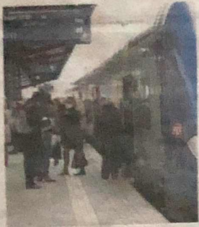
Les usagers des trains devront encore s'armer de patience.