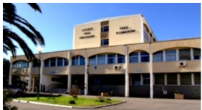
Lycée Paul Vincensini