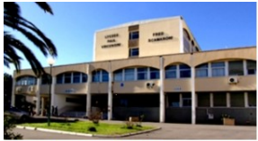
Lycée Paul Vincensini