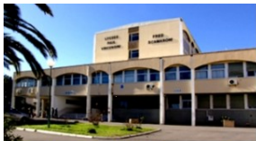
Lycée Paul Vincensini