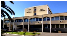
Lycée Paul Vincensini