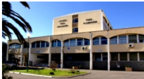
Lycée Paul Vincensini