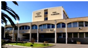
Lycée Paul Vincensini