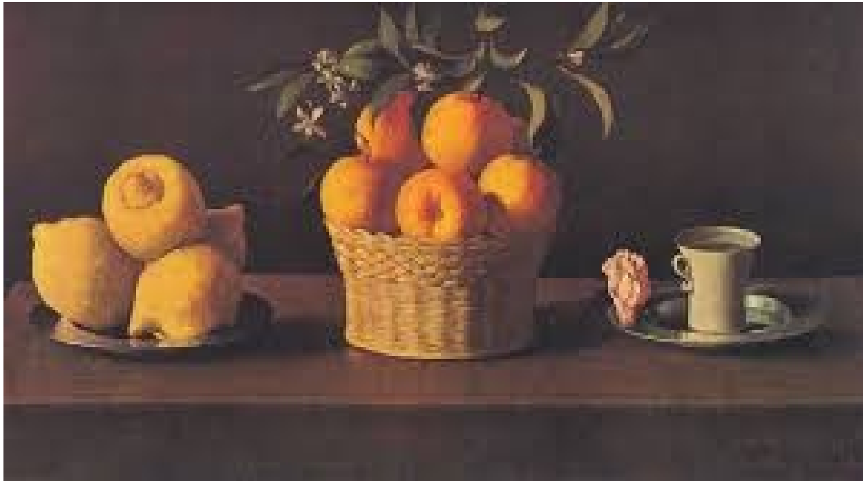
Plato con limones , cesta con naranjas y taza con una rosa , 1633