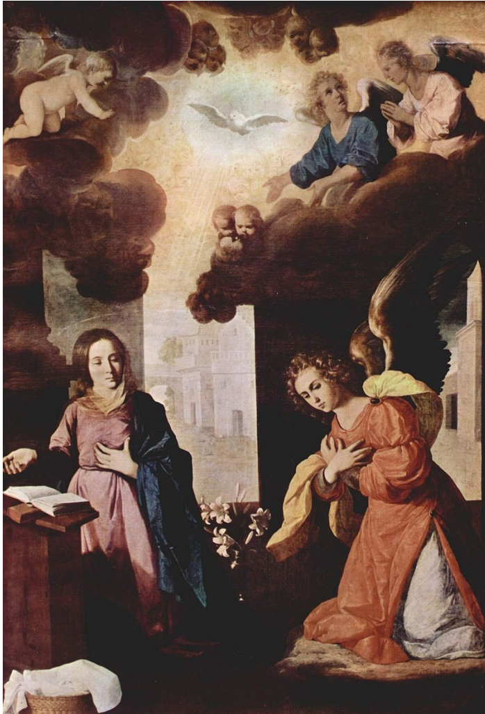
La anunciación en 1638