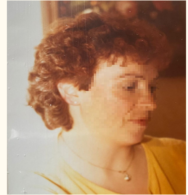
C'est un « Bob »