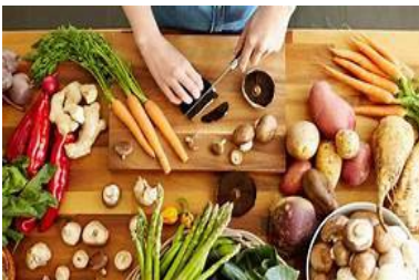
Sta tagliando la verdura

Che cosa stanno facendo? Descrivi le immagini come nell'esempio.