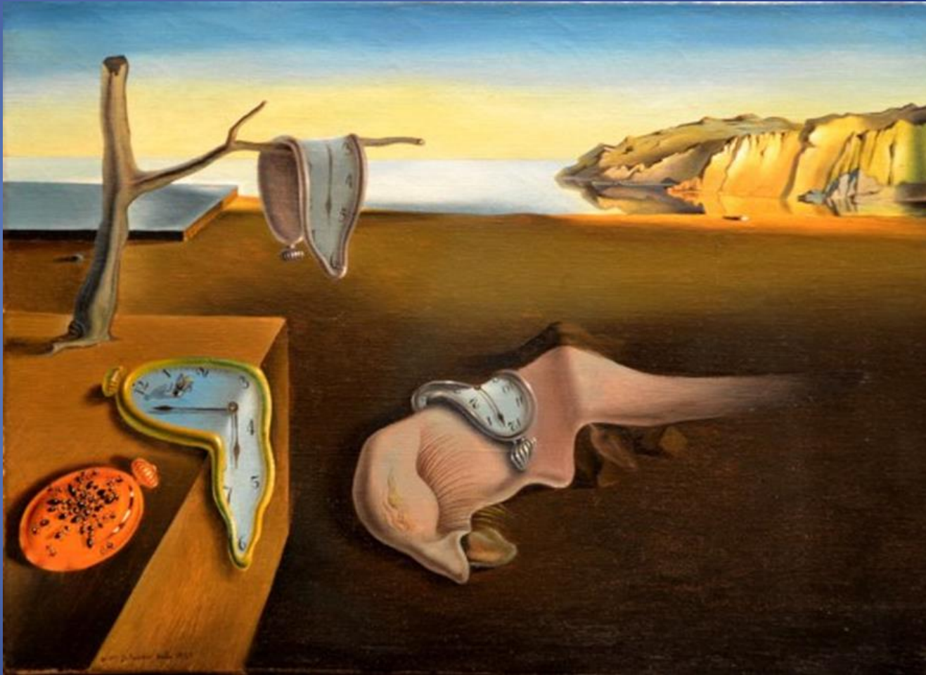
SALVADOR DALÍ: "LA PERSISTENCIA DE LA MEMORIA"