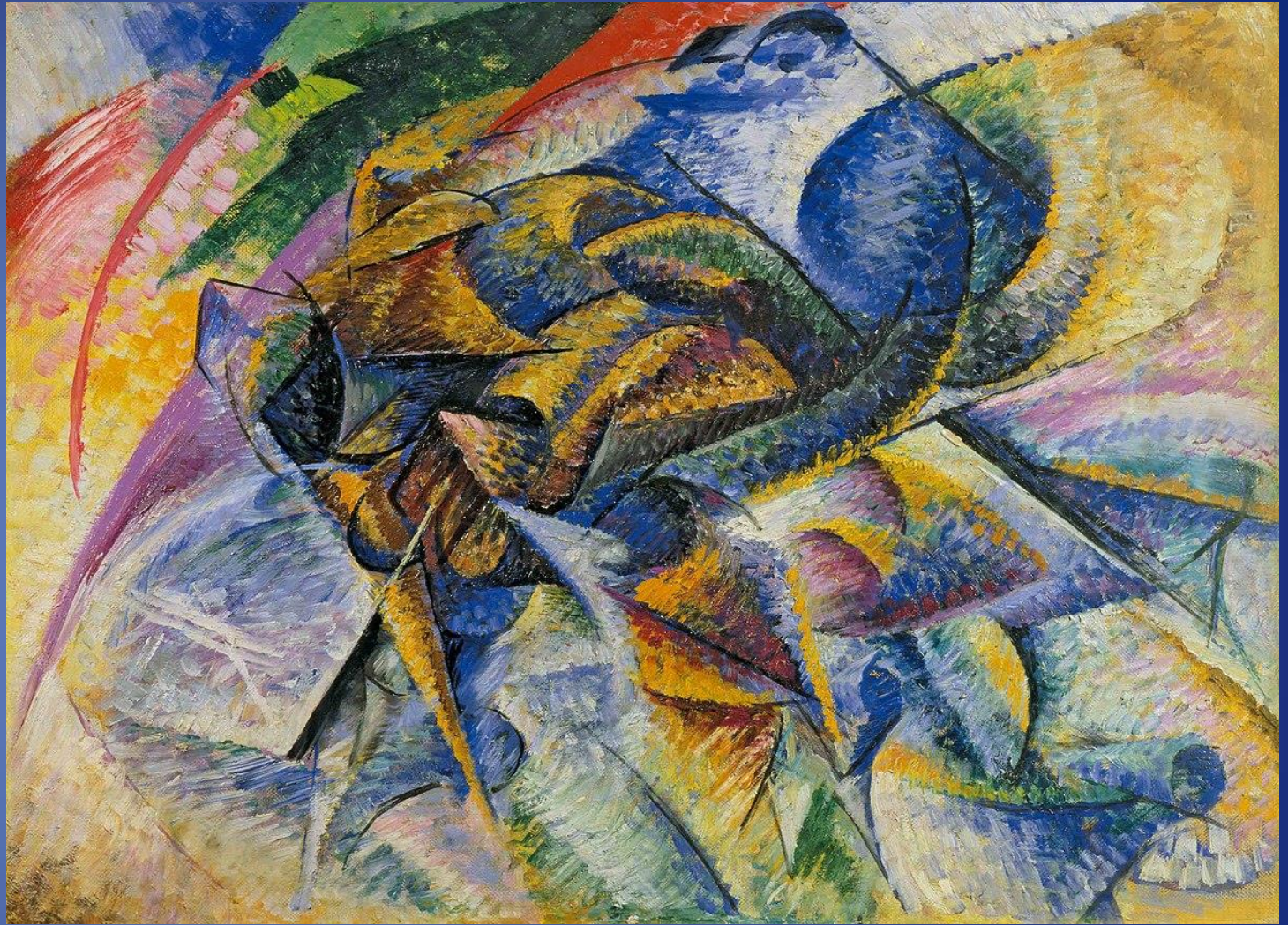
Umberto Boccioni , Dinamismo de un ciclista ,