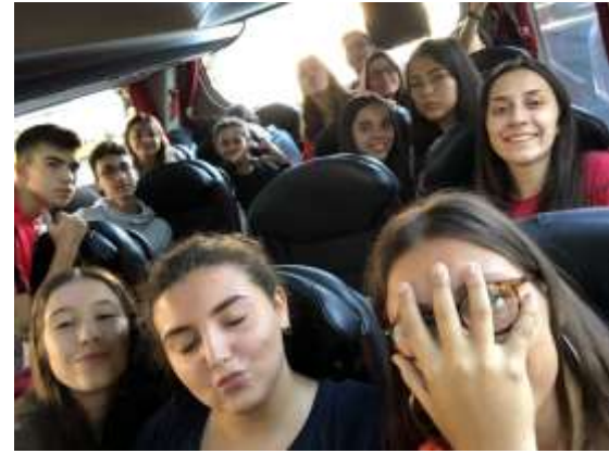
Dans le car, nouveau, décapotable, joli, confortable, fantastique... parfait (en réalité nous étions très tristes mais nous avons à sourire sur la photo)