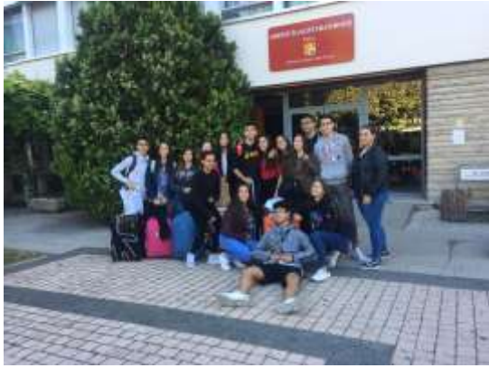
Des minutes avant de partir