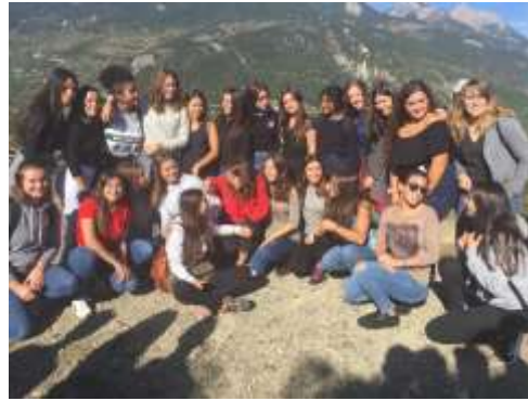
Dans le Fort (1- tous, 2- les femmes)