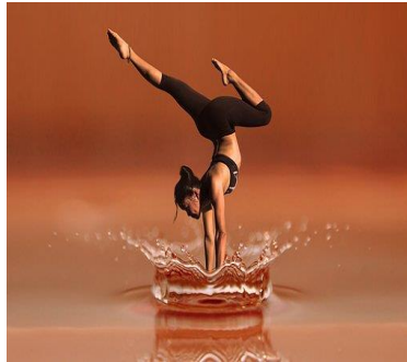
das Gymnastik ,-en