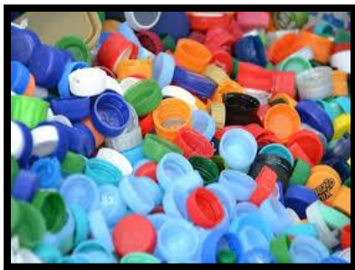
die Deckelsammlung,-en nen