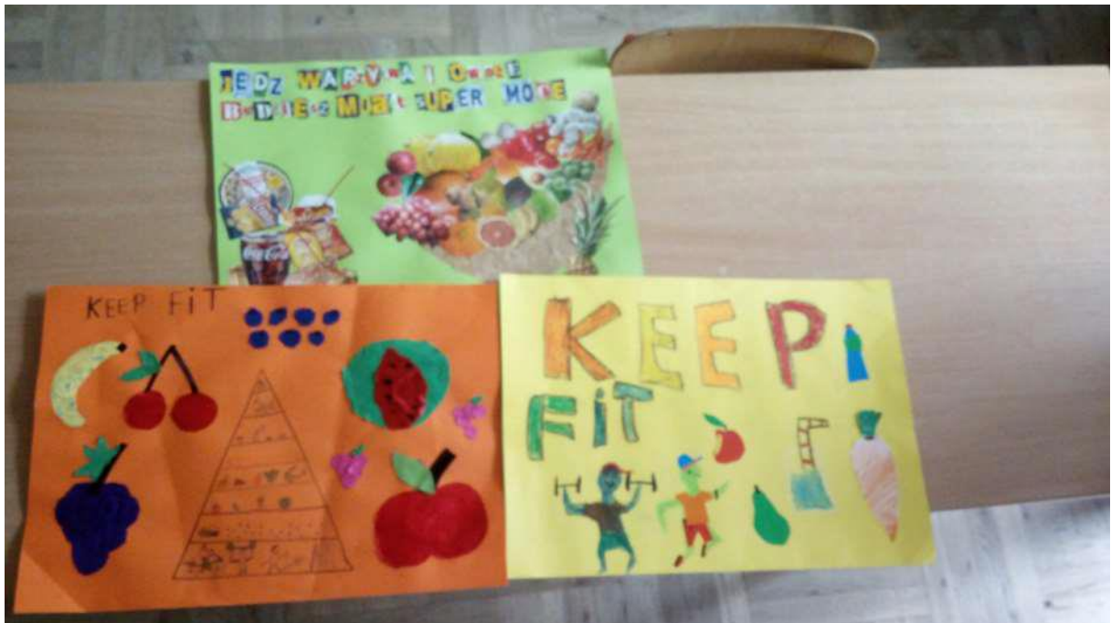
Groep 6A: "Gezond eten".