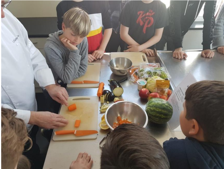
in het smaakcentrum, gezond voedsel