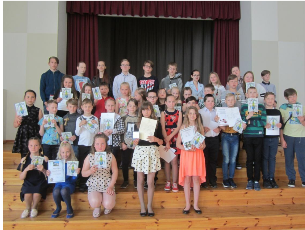
De winnaars van de verschillende wedstrijden: plastic doppen verzamelen, oud papier inzamelen, batterijen inzamelen etc.