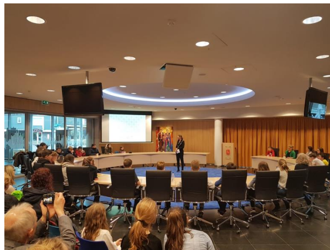
in het stadhuis van Boxmeer