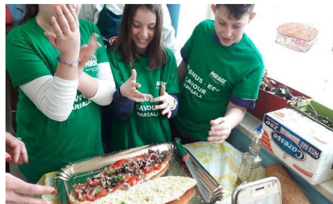
brood en honing