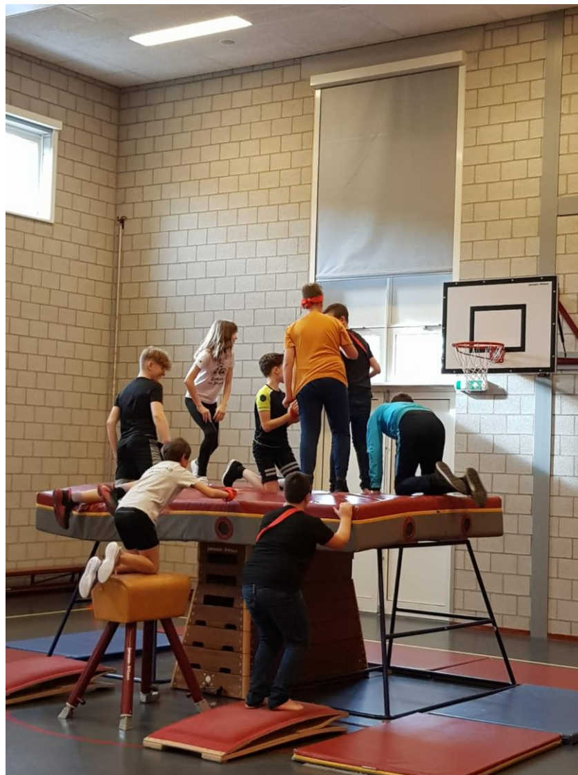
sportles in internationale groepen