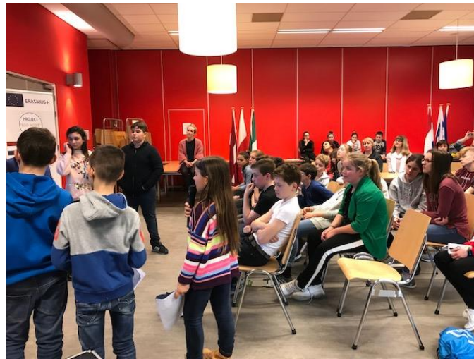
presentaties door kinderen