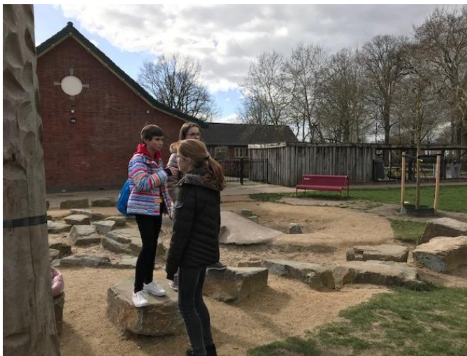
elkaar leren kennen in het park