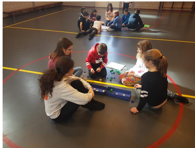
spelletjes in internationale groepen