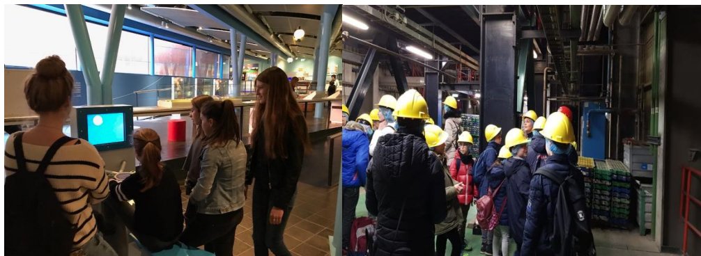
watermuseum en afvalverwerker