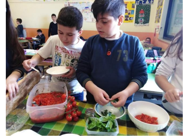
Over kleuren en smaken