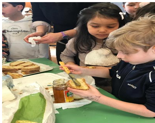
Brood en tomaten

Van 8 tot 12 April kinderen bereidden gezonde maaltijden voor. Kinderen ontdekten dat eenvoudige ingrediënten en seizoensgebonden voedsel vaak erg smakelijk kunnen zijn.