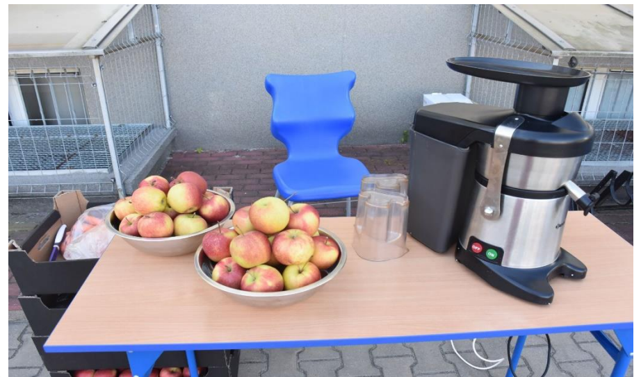
Hurtownia ANANAS częstowała owocami.