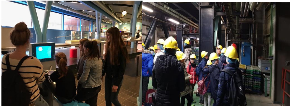
Wycieczka do Muzeum Wody i Zakładu utylizacji śmieci ARN.