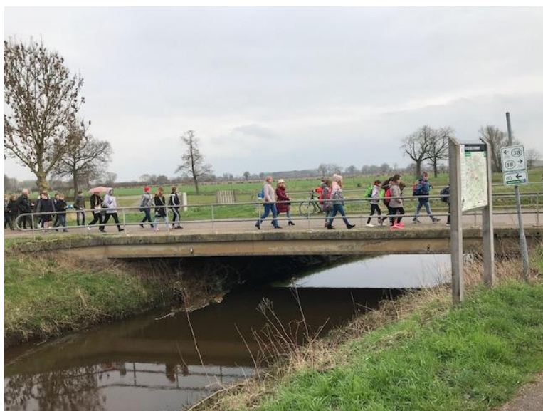
Wycieczka do tamy w Sambeek, ekologiczny spacer po okolicy