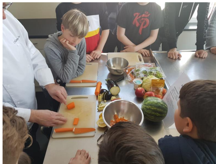
Zajęcia kulinarne w Centrum Smaku

Spędziliśmy cudowny Eko-tydzień z naszymi europejskimi kolegami !!!