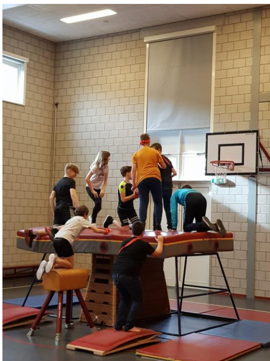
Lekcja w-fu w międzynarodowych grupach