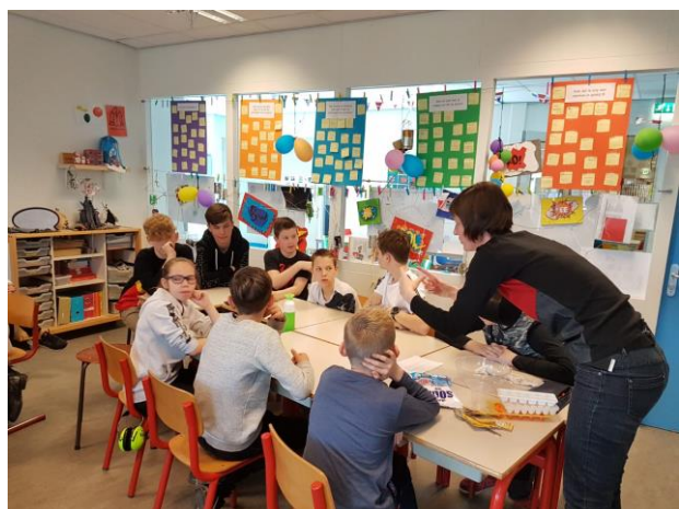
Lekcje dla uczniów z krajów partnerskich