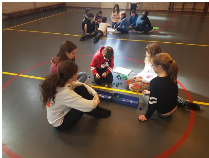
Granie w eko-gry w międzynarodowych grupach