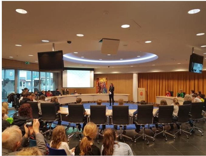
Prezentacja w Urzędzie miasta Boxmeer