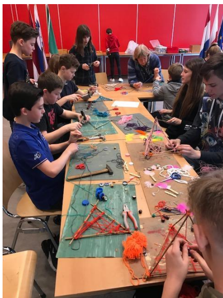
Zajęcia artystyczne przeprowadzone przez nauczyciela ze szkoły holenderskiej