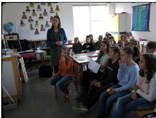
Beelden uit de videoconferenties Polen-Letland en Letland-Nederland.