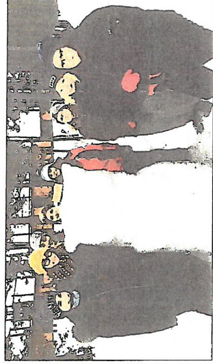
Auch gemeinsames Schneemann-Bauen stand auf dem Programm.

Auch ein Gegenbesuch der finnischen Projektpartner ist bereits geplant. Im Mai kommen sie nach Türritz.