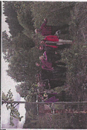
Lappilaiset istuttivat myös hankkeen nimikkositrupuun.

Viimeisen illan jäähyväisillallisella nautittiin paikallisesti kasvatettua taimenta sertifioitulla kalankasvatustamolla. Itävallassa kala ei kuulu läheskään jokaisen perheen ruokapöytään, vaan kalan