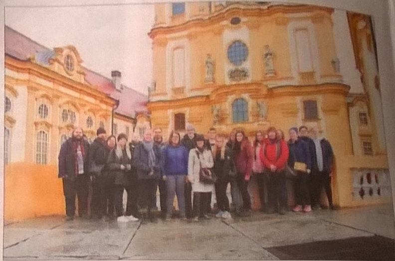
Kaupunkikohteita, ja alla maalaismarkkinoita vuorissa. Keski-Euroopassa oli vielä ruska ja syksy, kun Levillä jo lasketeltiin.

Molempien oppilaitosten opiskelijat työstivät yhteistyönä tiimeissä metsä-aiheisen projektin lopputuotteita, joiksi valikoitui valokuvakirja projektin koko ajalta vuosilta 2016–2018 sekä puinen avaimenperä, johon polttoleimattiin projektin logo.