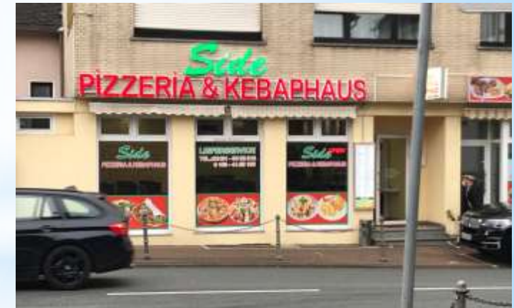
La maison de kébab „Side“