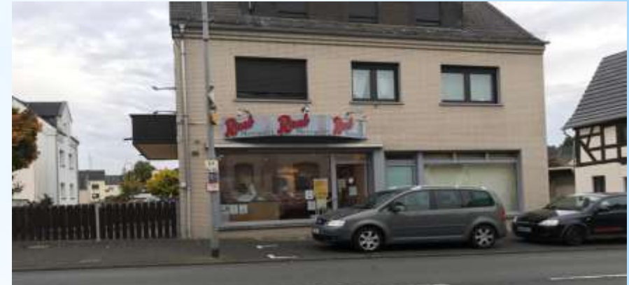
La boucherie „Raab“