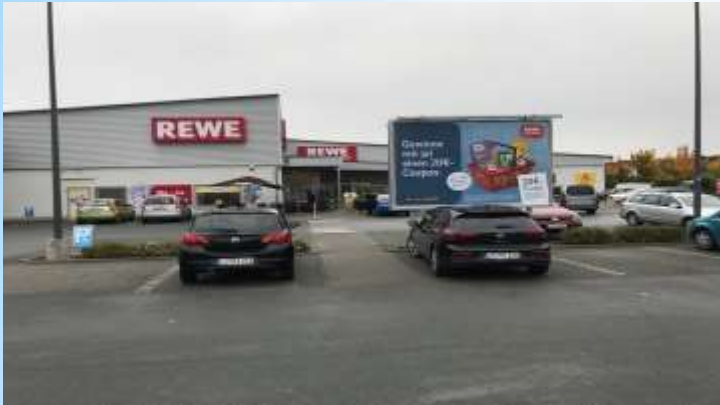
Le supermarché „Rewe“