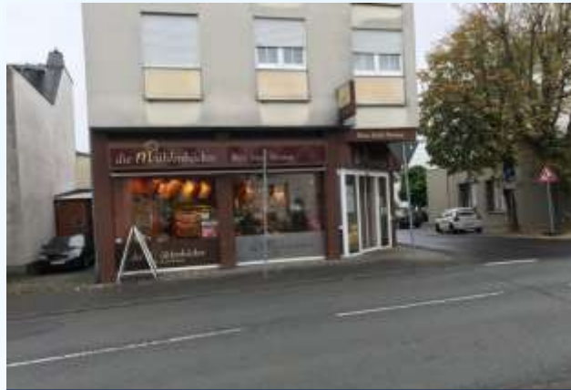
Les boulangeries „Mühlenbäcker“ et „Schäfer“