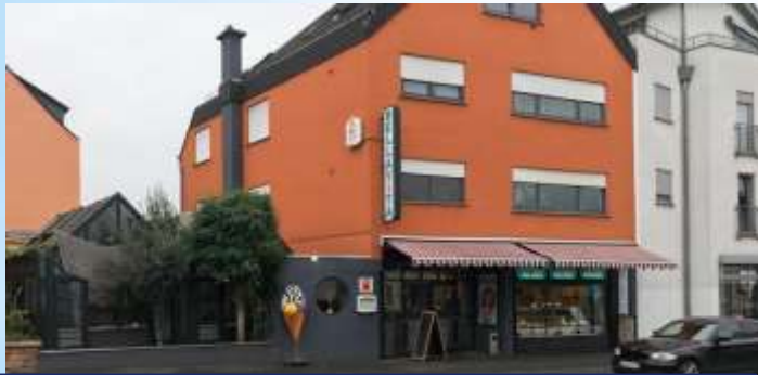
Le glacier „Bellavita“