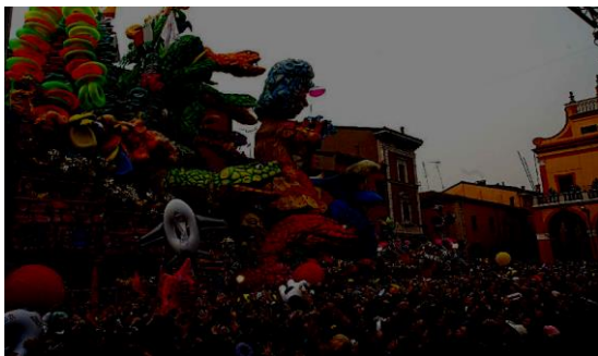
Carnaval de Cento (Ferrara)

En general, los elementos comunes de los carnavales en Italia son los corteos con carros alegóricos o a pie, y los trajes muy elaborados. Un ejemplo es el carnaval de Cento hermanado con el de Rio de Janeiro por los enormes carros (20 metros de altura), de donde se lanzan dulces y peluches. Así como se suele hacer en el carnaval de Viareggio y Fano.