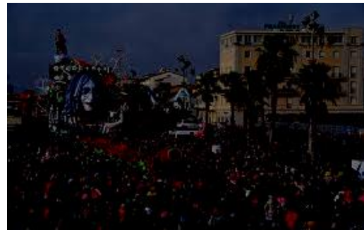
Carnaval de Viareggio